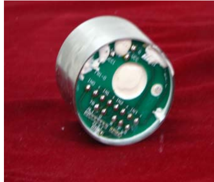
微型抗高冲击信号记录仪

微型抗高冲击记录仪可在高冲击（>30000g）恶劣环境里记录加速度、压力、温度及旋转速度等参数，记录时间可达 130s 以上，通过回收，将记录的数据回放到计算机中，进行数据处理。该系统主要由前置运放电路、多路独立的数据采集与处理电路、时序控制电路、CPU 控制系统、FLASH 数据存储系统、数据回放电路、内接电源/外接电源、数据回放软件及数据分析软件等部分组成。