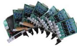
热电偶系列高精度线性信号隔离调理模块