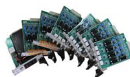
频率信号隔离调理模块