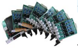
电压系列高精度线性信号隔离调理模块