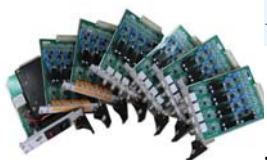
应变系列高精度线性信号隔离调理模块